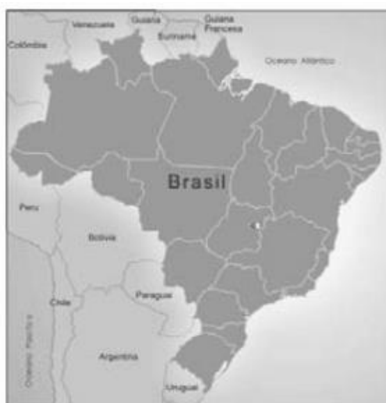
Mapa 1 – Fronteiras do Brasil

retrato, figura, imagem, entre outros), seguida de seu número de ordem de ocorrência no texto, em algarismos arábicos, de travessão e do respectivo título. Imediatamente após a ilustração, deve-se indicar a fonte consultada (elemento obrigatório, mesmo que seja produção do próprio autor) conforme a ABNT NBR 10520, legenda, notas e outras informações necessárias à sua compreensão (se houver). A ilustração deve ser citada no texto e inserida o mais próxima possível do trecho a que se refere. Tipo, número de ordem, título, fonte, legenda e notas devem acompanhar as margens da ilustração.